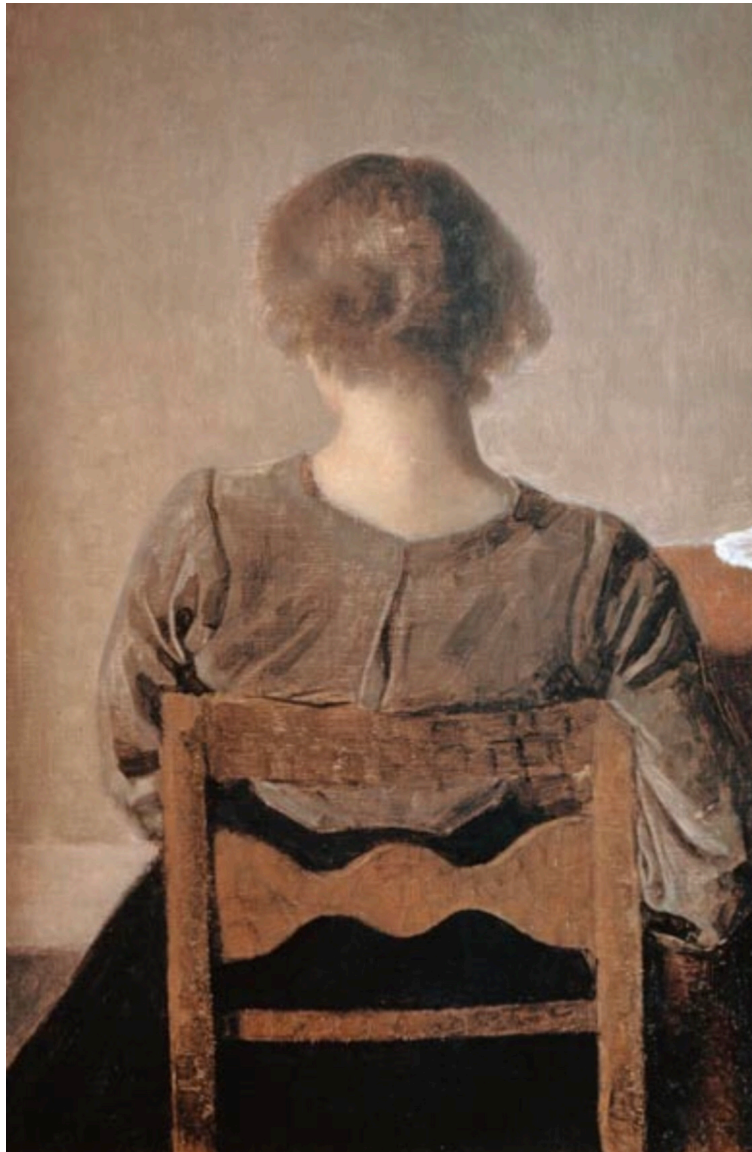
Vilhelm Hammershoi, Musée du Quai d'Orsay

~ Centre de formation à la Psychologie clinique et médicale